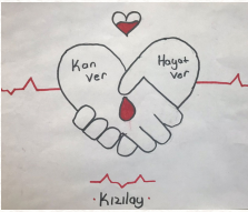
6C- Ravzanur Kavalcı