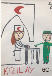
6C- Feride Dervişoğlu