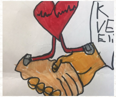
6B- Meryem Tanış